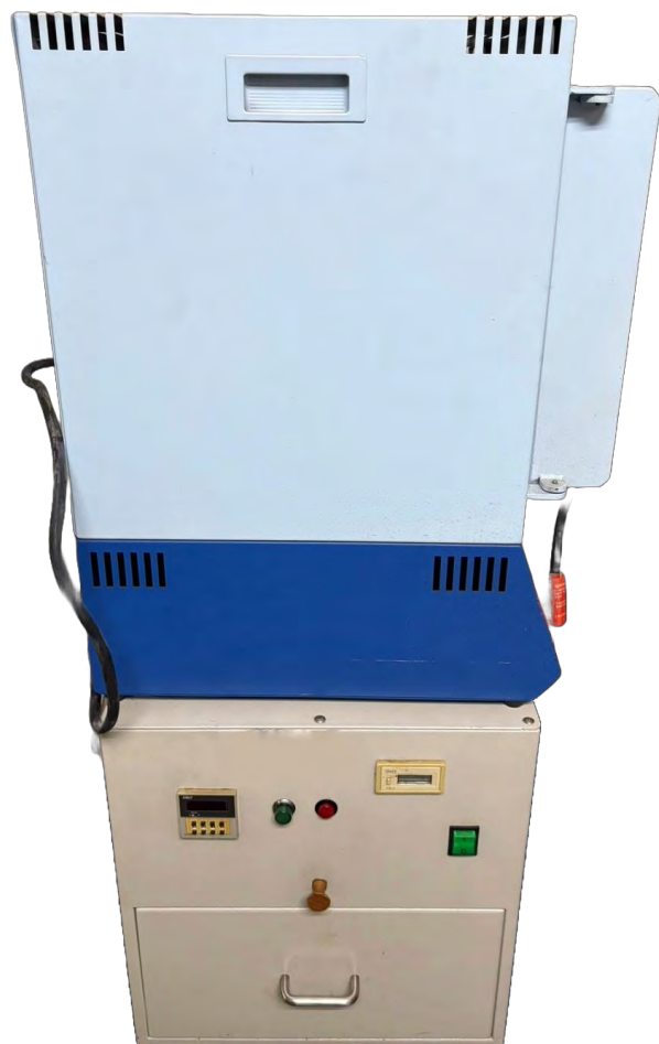
抽屜式紫外線固化箱