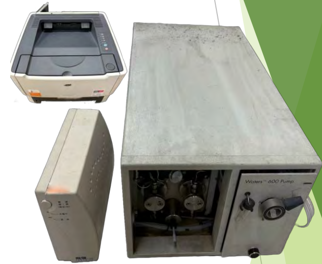
液相層析儀(含不斷電、印表機各一台)